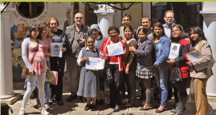
Teilnehmer des Workshops in Sucre (April 2013)