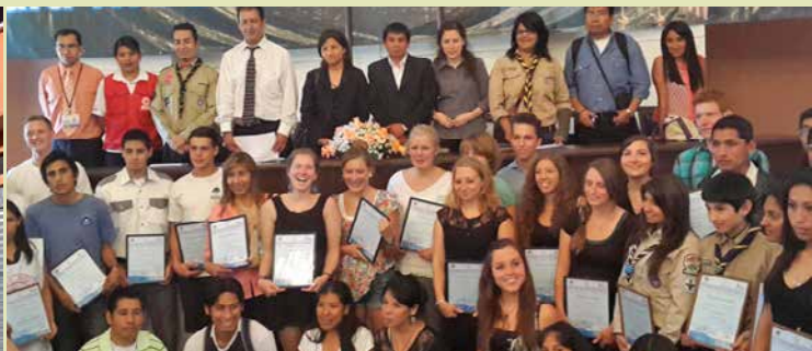
Foto vom Día del Voluntario (Tag des Freiwilligen) am 05.12.2013 in Chuquisaca