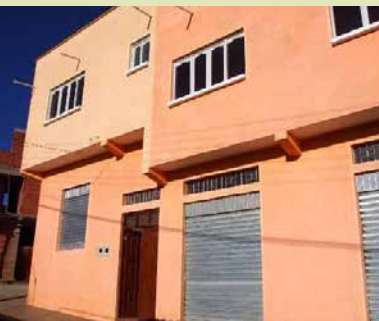
Das Gebäude von außen

Auch für ein von unseren weltwärts-Freiwilligen initiiertes Projekt zur Begleitung von ausscheidenden Heimkindern in Sucre konnten 8.000 US-$ bereit gestellt werden.